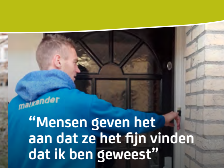
“Mensen geven het aan dat ze het fijn vinden dat ik ben geweest”