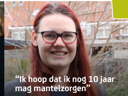
“Ik hoop dat ik nog 10 jaar mag mantelzorgen”