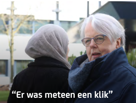
“Er was meteen een klik”