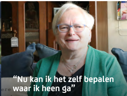
“Nu kan ik het zelf bepalen waar ik heen ga”