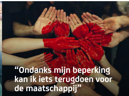
“Ondanks mijn beperking kan ik iets terugdoen voor de maatschappij”